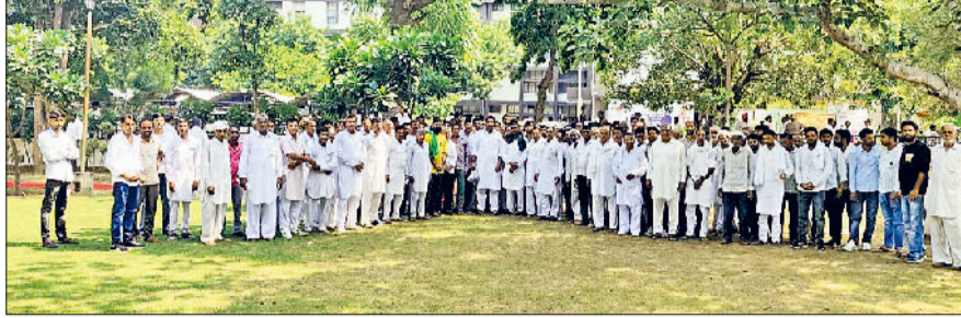
फतेहाबाद। डीसी से मिलने आए ग्रामीण।

तीन दिन के अंदर जांच नहीं हुई तो तहसील कार्यालय पर जड़ेगे ताला