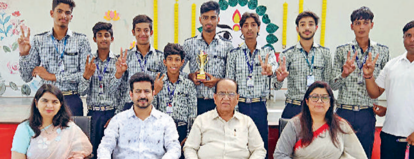
फतेहाबाद। विजेता खिलाड़ियों को बधाई देते स्कूल प्रबंधक।

भिवानी में 23 से 26 सितंबर 2025 तक स्कूल गेम्स फेडरेशन ऑफ इंडिया द्वारा आयोजित स्कूली खेलों के अंतर्गत अंडर-19 क्रिकेट टूर्नामेंट में पॉयनियर कान्वेंट स्कूल, फतेहाबाद की टीम ने उत्कृष्ट प्रदर्शन करते हुए द्वितीय स्थान प्राप्त कर रजत पदक अर्जित किया। टीम ने प्रो-क्वार्टर फाइनल में कुरुक्षेत्र, क्वार्टर फाइनल में जींद और सेमीफाइनल में पानीपत को पराजित कर फाइनल में जगह बनाई। फाइनल मुकाबला गुरुग्राम के साथ खेला गया, जिसमें खिलाड़ियों ने शानदार बल्लेबाजी और