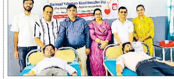
37 लोगों ने किया स्वेच्छा से रक्तदान

व्यवस्था का जमीनी स्तर पर जायजा लिया। इस दौरान उन्होंने नगर की सुरक्षा, यातायात प्रबंधन तथा नागरिकों की समस्याओं की वास्तविक स्थिति की समझते हुए