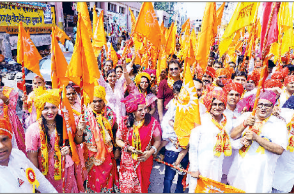
फतेहाबाद। शहर में भव्य शोभा यात्रा निकालते अग्रवाल समाज के सदस्यगण।