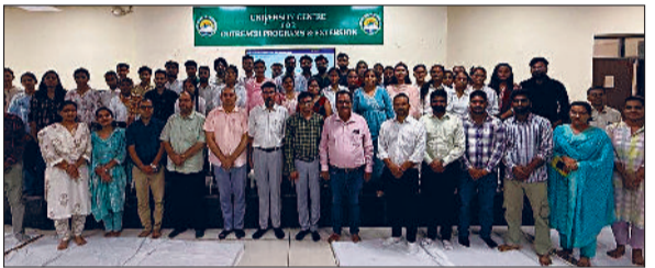
सिरसा। अतिथियों को सम्मानित करते हुए।