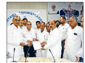
फतेहाबाद। ऑनलाइन रजिस्ट्रेशन उपरत लाभार्थी को प्रमाण पत्र सौंपते अतिथिगण व अधिकारीगण।