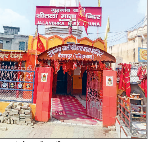
भूना। बैजलपुर गांव में माता शीतला मंदिर।