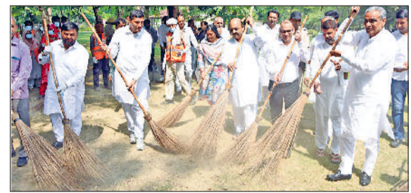
फतेहाबाद। बाबा साहेब डॉ. भीमराव अंबेडकर पार्क में स्वच्छता ही सेवा अभियान के तहत श्रमदान करते अतिथिगण व अधिकारीगण।