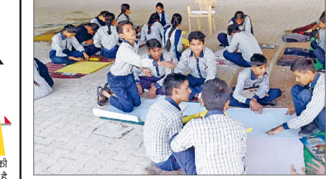
भूना। धौलू में सेवा पखवाड़ा के अंतर्गत विभिन्न रचनात्मक प्रतियोगिता में भाग लेते विद्यार्थी।