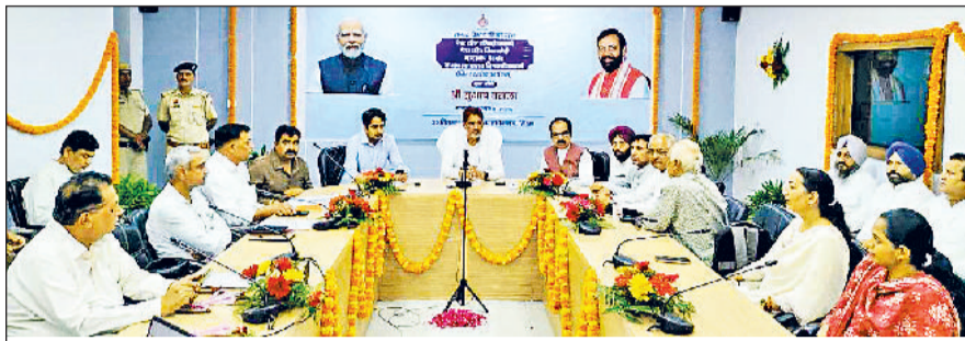
सिरसा। कार्यक्रम को संबोधित करते राज्यसभा सांसद सुभाष बराला।

राजस्व न्यायालय निगरानी प्रणाली व व्हाट्सएप चैटबोट से व्यवस्था में पारदर्शिता को बढ़ावा मिलेगा