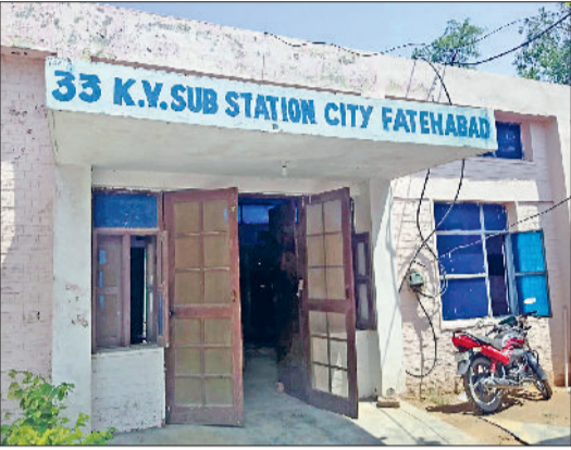
फतेहाबाद। बिजली निगम का जम्पर, बिजली डिमांड बढ़ने से ओवरलोड हुई मशीनरी व 33केवी सब स्टेशन

सोमवार को इस सीजन के सबसे ज्यादा बिजली के कट लगे