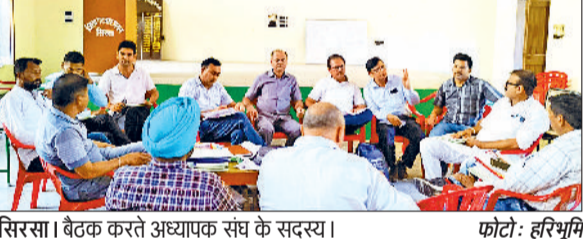
सिरसा। बैठक करते अध्यापक संघ के सदस्य।